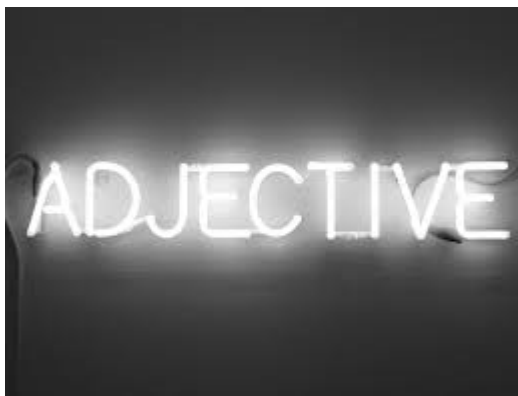
Imagen nº 1: Adjetivo.

En los módulos anteriores has estudiado las distintas categorías gramaticales así como los tipos de sintagmas en que aparecen. En este tema toca profundizar en la categoría gramatical del adjetivo y en los distintos tipos de adjetivos que hay.