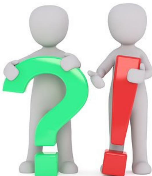
Imagen nº 8. Fuente: pixabay

https://pixabay.com/es/signo-de-interrogaci%C3%B3n-pregunta-2314115/