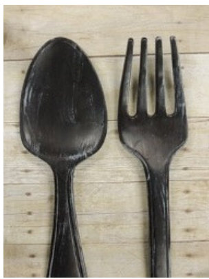
Imagen nº 3: Cuchara y tenedor.

En el cajón encontré un tenedor y una cuchara oxidados .