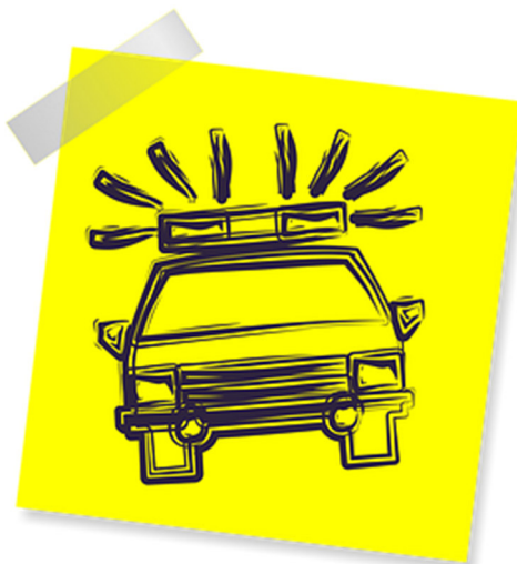
Imagen nº 9: Coche. Fuente: pixabay .

https://pixabay.com/es/polic%C3%ADa-coche-de-polic%C3%ADa-derecho-1468170/