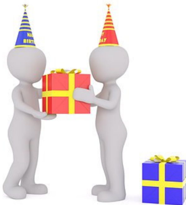
Imagen nº 10: Regalos. Fuente: pixabay .

https://pixabay.com/es/fax-var%C3%B3n-blanco-modelo-3d-aislado-1904654/