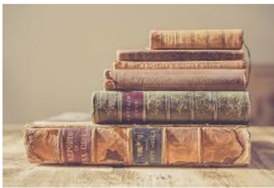
Imagen nº2: Libros

En estos ejemplos los, mis, algunos o cinco son determinantes dentro de un sintagma nominal y ayudan a identificar de qué libros estamos hablando. Como buena parte de las palabras que pueden funcionar como determinantes comparten algunos rasgos de los adjetivos (tienen morfemas de género y número y acompañan a los sustantivos), tradicionalmente se han clasificado como adjetivos determinativos, frente a los adjetivos calificativos que aparecen como adyacentes o como núcleo de sintagmas adjetivales. De este grupo se excluye el artículo, que forma una categoría gramatical propia.