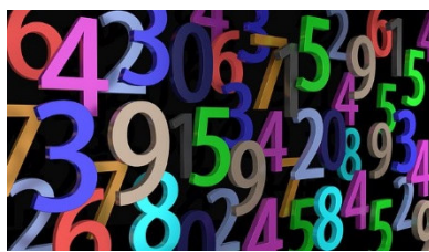
Imagen nº 7.

Los numerales acompañan a los sustantivos aportando información sobre la cantidad o sobre el orden. A diferencia de los indefinidos, esa cantidad está expresada de forma precisa.