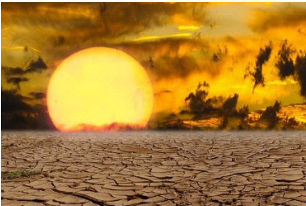
Imagen nº 4: Sol. Fuente: pixabay

https://pixabay.com/es/paisaje-la-naturaleza-puesta-del-sol-2806202/