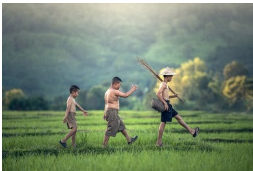
Imagen nº 6: Chicos caminando.

Cuando el artículo el aparece después de la preposición de da lugar al artículo contracto del . De igual modo, la preposición a se une a el en la forma al . Es incorrecto separar estos artículos contractos: *No recuerdo nada de el día en que te conocí . La excepción a esta regla la encontramos cuando el artículo forma parte de nombres propios o de títulos de obras: El autobús de El Escorial todavía no ha salido , Los personajes de El camino de Delibes son niños .