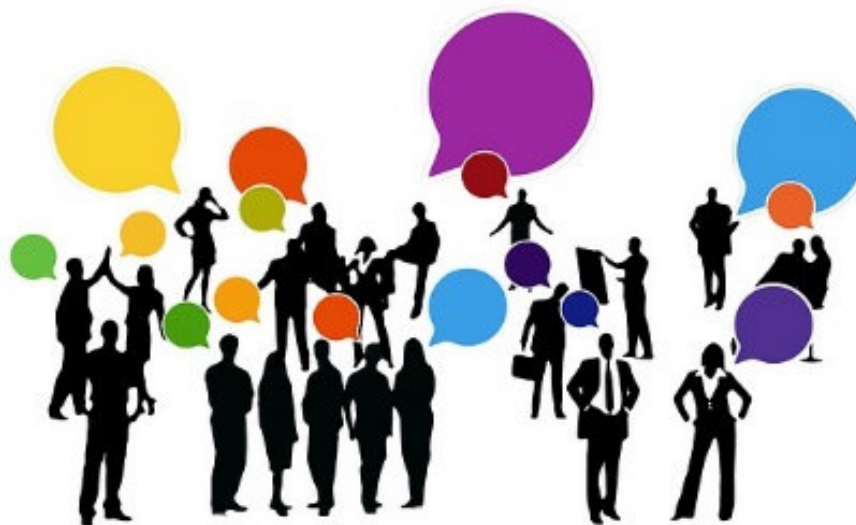
Imagen 1: Feedback Fuente: Pixabay https://pixabay.com/es/retroalimentaci%C3%B3n-confirmando-2990424/ Licencia: Creative Commons