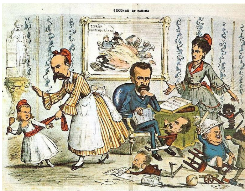
Imagen 1. Cosas

El nombre o sustantivo es la palabra que designa a los seres vivos (personas, animales, vegetales) los objetos y los conceptos. Ejemplos: niño, paloma, árbol, cuadro y alegría.