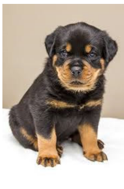
Imagen Nº 3. Perro. Fuente: Pixabay . Licencia: Creative Commons