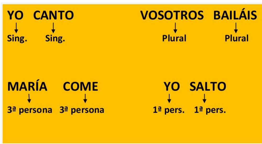
Imagen nº 5. Concordancia.

Así, localizaremos el sujeto en una oración comprobando dicha concordancia: